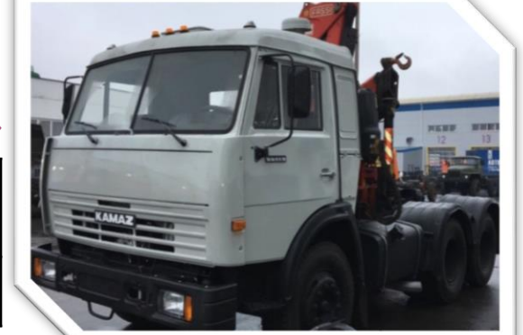
После капитального ремонта