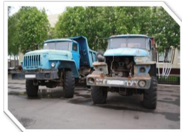
Урал-55571 Предприятие по строительству нефтегазопроводов