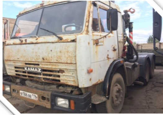
До капитального ремонта